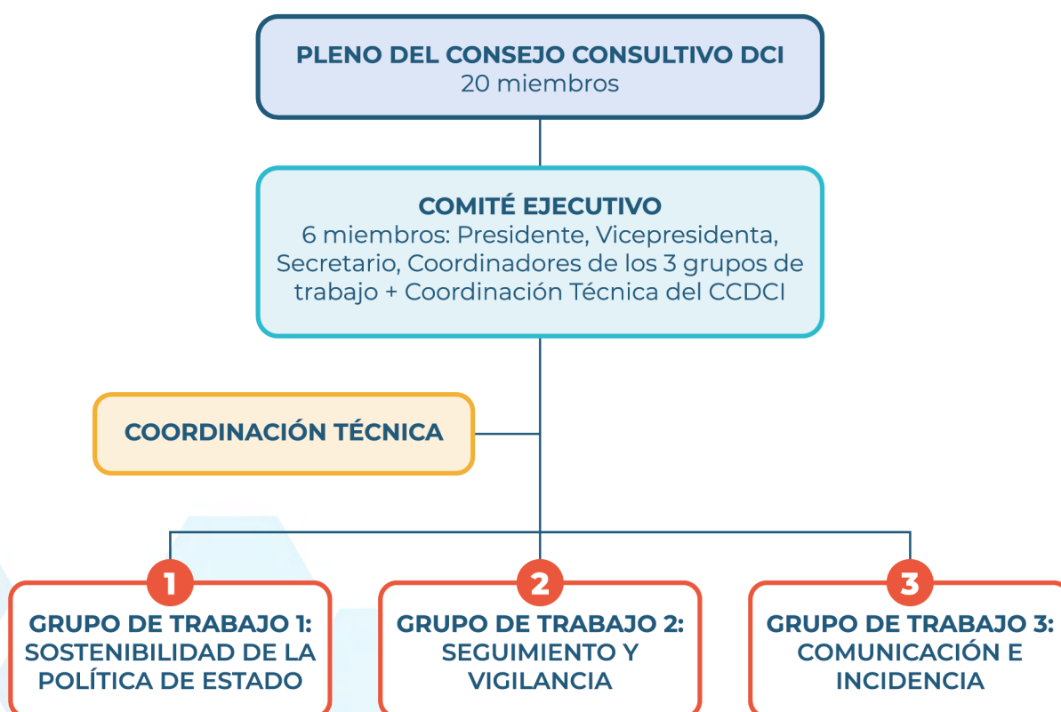
Gráfico 1: Organigrama del CCDCI

A continuación, se presenta el Organigrama del CCDCI::